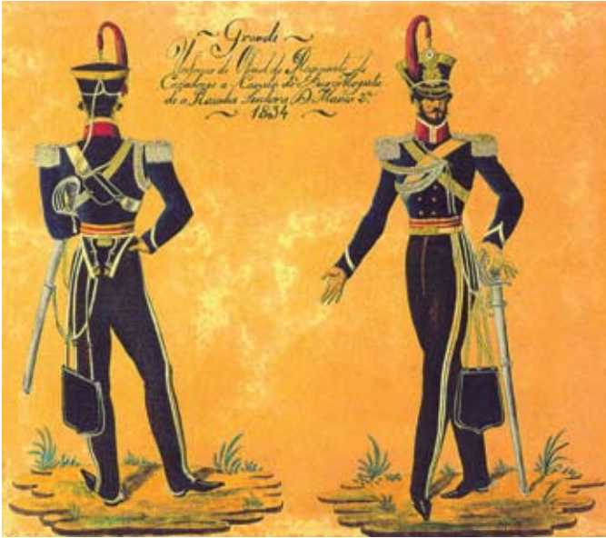
Uniforme oficial do Regimento de Caçadores a Cavalo em 1834.