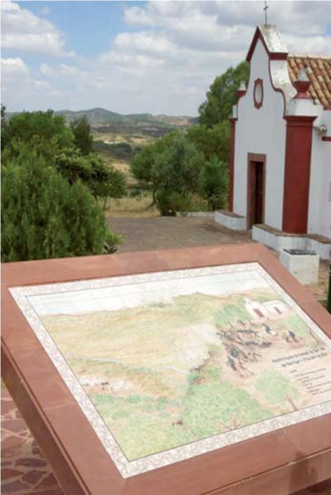
Ermida erigida no local onde decorreu a batalha de Santana da Serra.

Um clima persecutório e de justicialismo popular, contra o qual as autoridades não se insurgiam com eficácia, gerou uma onda de indignação, com repercussões na imprensa nacional e sobretudo estrangeira, que quase diariamente relatava episódios de assaltos e assassinatos por todo o país. Contudo, o fulcro da instabilidade e da insegurança nacional instalara-se particularmente no Baixo Alentejo e na serra algarvia, em cujos recônditos se acoitavam antigos soldados do exército realista, misturados com camponeses,