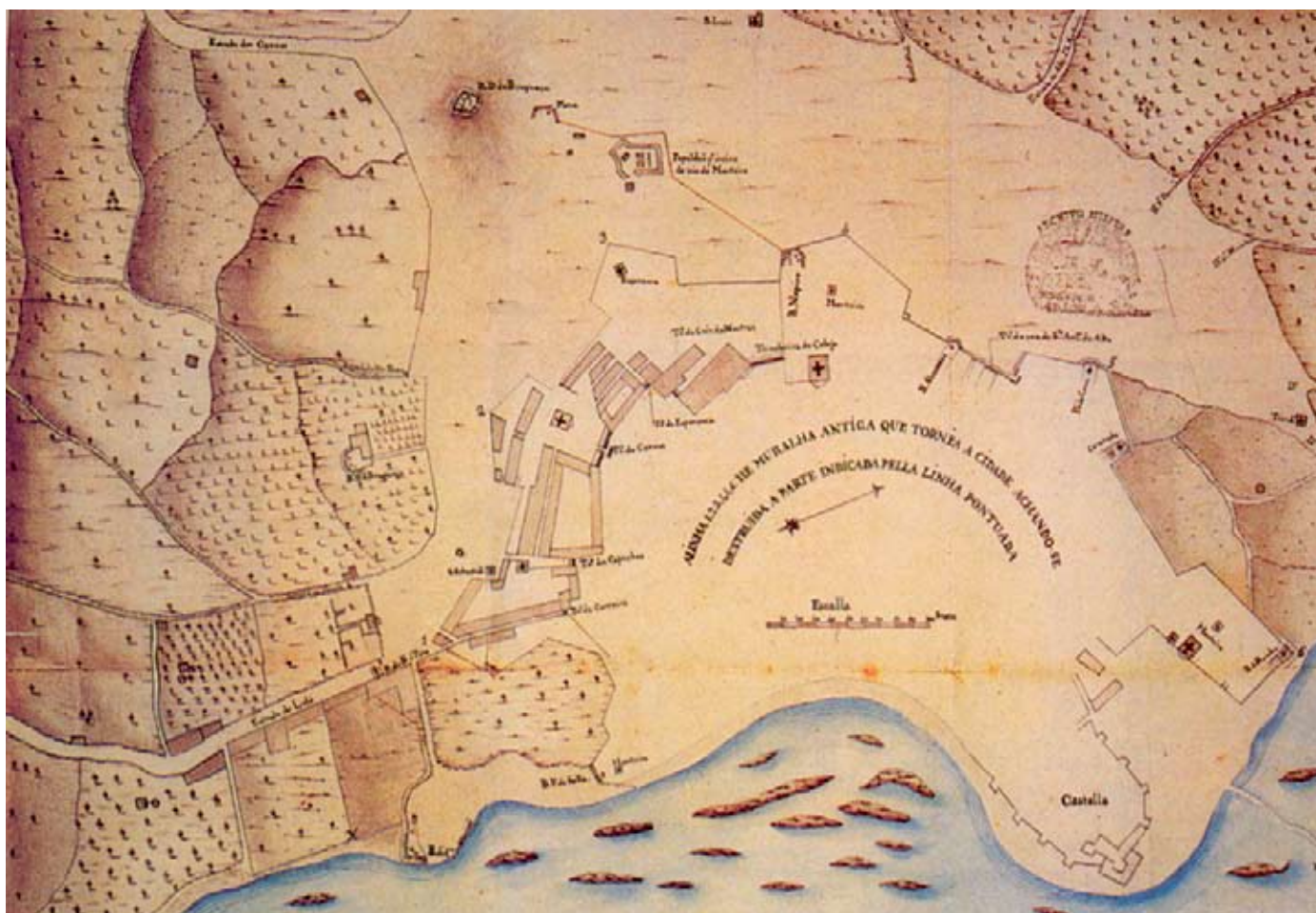
Planta do exterior da cidade de Faro, indicando todas as obras de fortificação contruídas para a defesa militar da mesma pelo 2º Tenente Engenheiro Rufino António de Moraes. O pormenorizado traço desta planta foi levantado pelo Coronel Pereira do Lago, em 1834.

fosse solucionado com a maior urgência faltavam os meios financeiros. E neste caso o cor. Fontoura não teve pejo em lançar mão dos seus poderes despóticos. Exigiu dos algarvios a concessão de um empréstimo forçado no valor de vinte e cinco contos, que obteve mediante a promessa de limpar a serra da perigosa cabilda do Remexido, dos Baioas e do Marçal Espada. O Administrador Geral do Distrito de Faro, resumiu o evoluir das exigências legais e das faculdades administrativas ao seu dispor tendentes ao financiamento das tropas, nos seguintes termos: